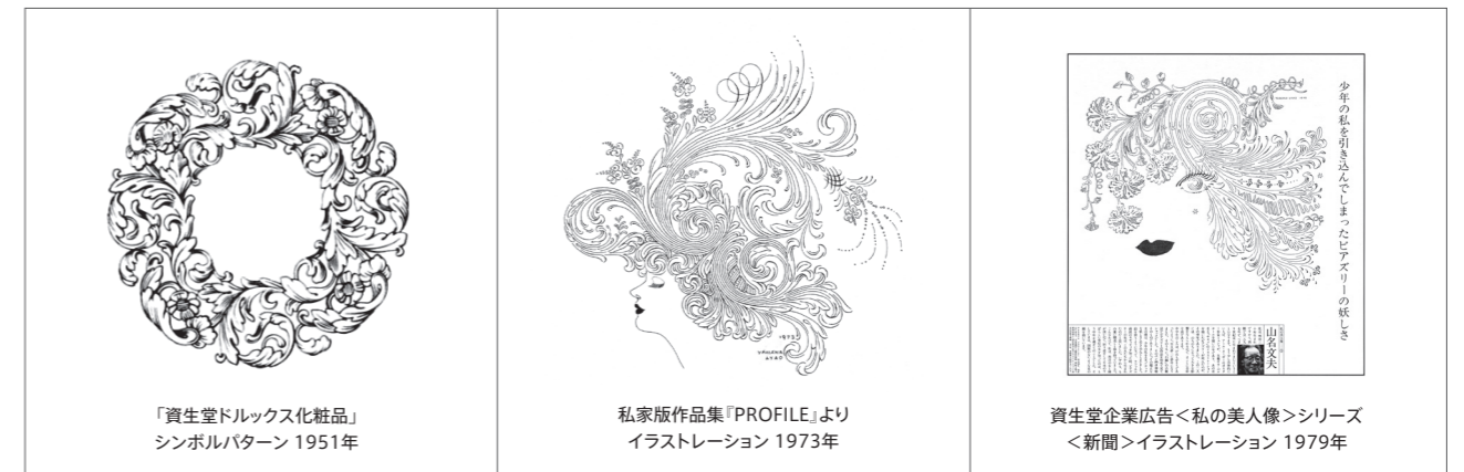
「資生堂ドルックス化粧品」シンボルパターン 1951年