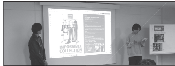
最終選考は審査員の前でプレゼン

2月12日、最終選考が行われ、YLW本選と同様の形式で、各チームが審査員に対してプレゼンテーションを実施。プレゼンおよびその後の質疑応答はすべて英語で行われました。鋭い質問が次々と飛び交う中、回答に苦しい場面も見られましたが、参加者たちは丁寧に自分たちの考えを伝えていました。すべてのプレゼンと質疑応答が終了した後、その場で審査が行われました。