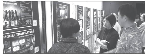
審査員に意見をもらう参加者

今回のPreADFESTには約230名の選考参加者や関係者が来場し、大変熱気にあふれたイベントとなりました。