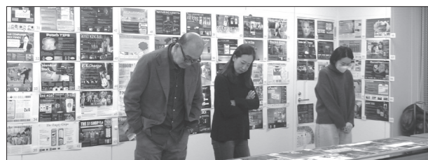
真剣な審査の様子

一次選考へは121チームが参加しました。今回の課題は「20代の若者が金融を前向きに捉え、自信をもって向き合えるアイデア」という難易度の高いテーマでした。各チームはそれぞれの視点から課題解決につながるアイデアを作品として提出。その後、1月23日に7名の審査員による厳正な審査が行われ、最終選考へ進むファイナリスト5チームが選出されました。