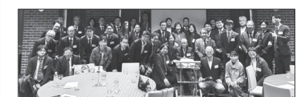
結束力抜群! 京都・神戸・大阪の会員が大集結