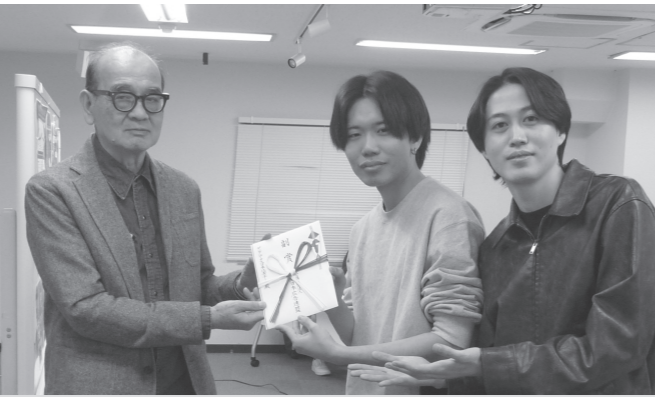
鏡審査員長(左)と日本代表チームの2人