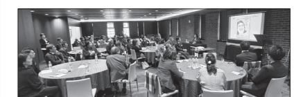
昭和広告を学ぶ参加者

参加した若手会員は「逆に新しい」と驚き、ベテラン会員は「懐かしい」と語るなど、世代を超えた交流が生まれ、研修会は盛況のうちに幕を閉じた。